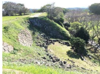
【唐津市】「肥前名護屋城跡」見学