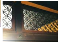
「鯨組主 中尾家屋敷」県指定重要文化財 見学