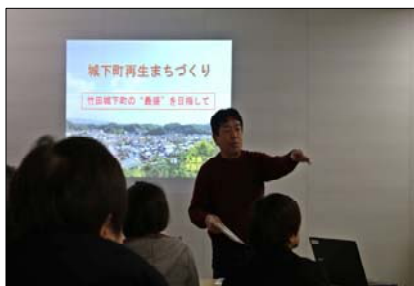
竹田市の城下町や歴史について レクチャー