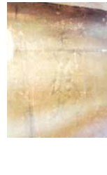
『魅力ある和の空間ガイドブック』掲載建物です!