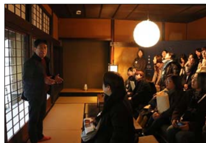
400年の歴史がある旧岡藩迎賓館「御客屋 月鐘楼」を見学