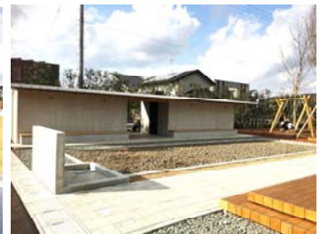
【江北(こうほく)町 建物見学】 「みんなの公園」(2019.11オープン) 町の中心にあり、防災施設を備えている