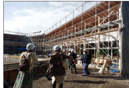
会員設計の店舗兼飲食店新築工事現場を見学（もくあみの杜）