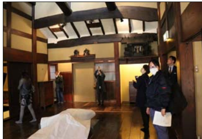
湯布院御三家の一つ「山荘無量塔（むらた）」見学