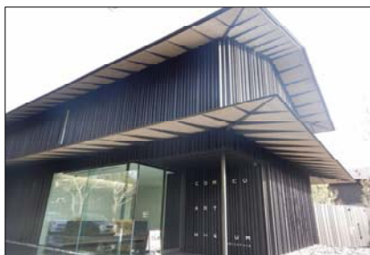
隈研吾氏設計「モコアートミュージアム」外観見学