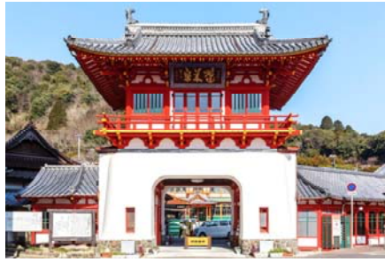
【武雄温泉楼門】国指定重要文化財 二階天井の四隅に子(ね)卯(う)午(うま)酉(とり)の彫り絵があり、干支(えと)の十二支の内の4つで、方角でいえば「東西南北」にあたる。東京駅丸の内駅舎南北ドームの天井に、丑(うし)虎(とら)辰(たつ)巳(み)未(ひつじ)申(さる)戌(いぬ)亥(い)の8つの干支のレリーフが東西南北を除く位置で配置されており、楼門の4つの干支と東京駅の8つの干支を合わせると十二支が揃うことがわかった。