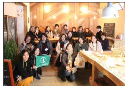
古民家をリノベーションした宿泊施設「ホテルcue」を見学