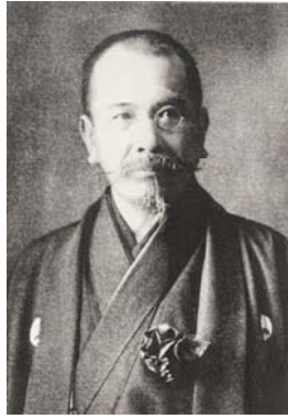
1854年生～1919没 佐賀県唐津市出身 工学博士 日本の近代建築の礎を築いた