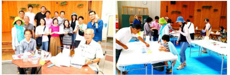
【佐賀市】「水鏡(みづかがみ)プロジェクト」への参加 佐賀城のお堀を使った灯りのイベント(地域交流型)