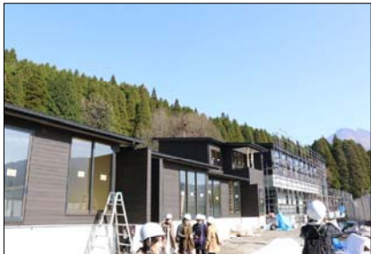
会員設計の旅館新築工事現場を見学（由布院ZEN）