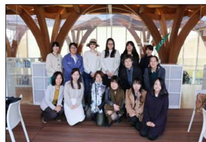
坂茂氏設計の「由布市観光インフォメーションセンター」を見学