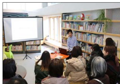
竹田市立図書館（設計者塩塚隆生氏による解説トーク）