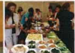
相馬支部の企画によるランチbuffet。 地元産の野菜を会員が協力して調理。 20回記念VTRを鑑賞しながら会費。