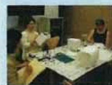
上川崎和紙行灯製作(第17回)