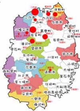
岩手県内芝棟分布状況 (調査途中)

女性委員会 20周年記念事業「藤森照信氏講演会」 平成21年2月13日(金) 於：岩手県公会堂 150名参加 (建築士会会員ほか一般市民含み) 藤森氏・小川会長を囲んで女性会員限定の記念写真