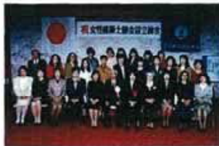
平成22年2月「女性建築士会」設立 『女性建築士のつどい』 開催の記録