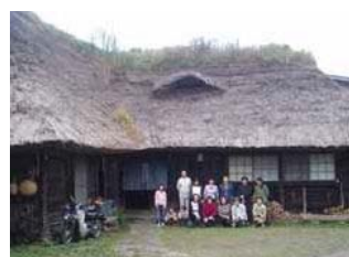
芝棟民宿見学会 県北の野田村にある民宿苫屋 (築150年)。 所有は野田村で、H21年12月～22年3月にかけて屋根の葺き替え工事を終了。