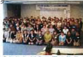
「あたただらの里に集う」 -第2回東北ブロック会共催-