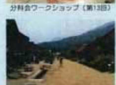
南会津下郷町大内宿見学(第16回)