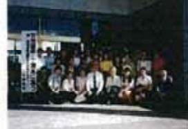
「潮風にっとう会」 -いわき-