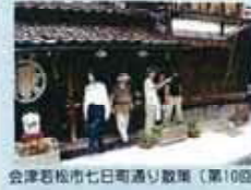
会津若松市七日町通り散策(第10回)