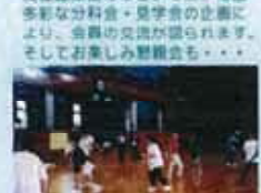
ドッジボール大会(第8回)