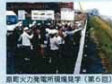
原町火力発電所視察見学(第6回)