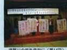
清川川の宝を供々に(第14回)