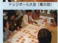
分科会ワークショップ(第13回)