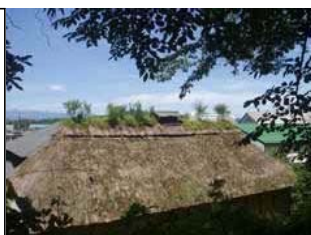
玉山・啄木記念館内の斉藤家住宅 (ユリ・キキョウ・ハギ)

芝棟民家の調査活動 藤森先生より「芝棟という貴重な民家が北東北、特に岩手にはまだ多数残っている。是非岩手の皆さんには、芝棟民家について造詣を深めてほしい」とのこと。これをきっかけに北東北茅葺きネットワークの協力も得、岩手県内の芝棟民家を調査中。改めて、県内の歴史的建物の価値に気付いています。