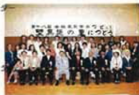
「野馬追の里に集う」 -相馬-