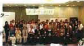
「アーキ・ウー・踊るとき」 -郡山-