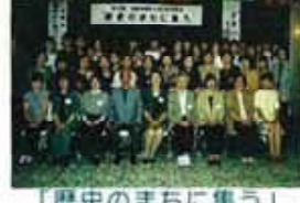
「歴史のまちに集う」 -会津-