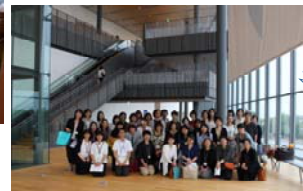
富山県美術館見学会