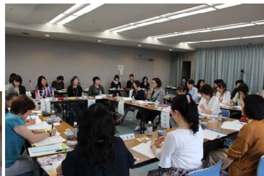
平成30年度前期定例(富山)会議 2018年6月23日 ボルファート富山にて