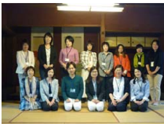
企画① 2016年5月21日 高岡市土蔵造のまち資料館「HABUNKO」にて 活動報告会、伝統芸体験会