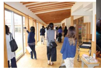
企画② 2016年9月17日 高齢者・障がい者・児童福祉施設 「あしたねの森」にて見学会