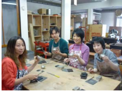
錫(すず)の「ぐい飲み」作り体験