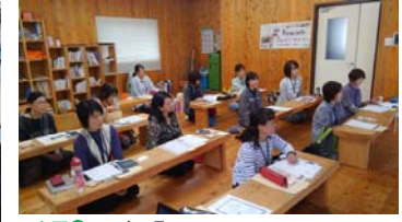
企画② 2017年9月16日 水見市(株)岸田木材及び水見里山周辺にて 森の見学会、講演会(岸田氏)、工場見学