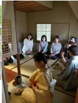
「茶室を学ぶ若葉の茶会」で、 お茶室体験