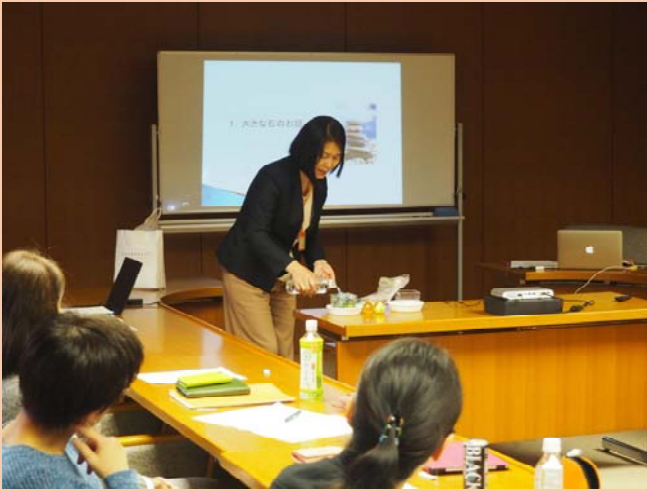
(研修会：片付けセミナー)