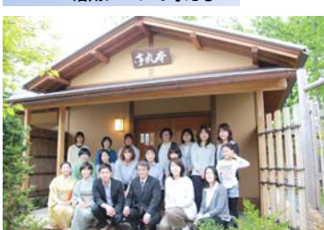
企画① 2018年5月3日 富山市城址公園内 本丸亭にて 活動報告会、お茶室セミナー