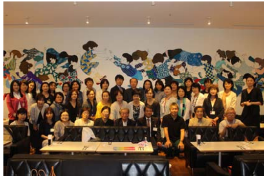
県会館内「D & department Cafe」にて 富山県建築士会女性委員会30周年記念交流会