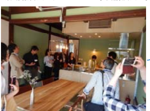
企画① 2019年5月22日 新湊・内川のオフィスma.ba.lab&水辺の民家ホテル「カモメ」と「ウミネコ」にて 活動報告会とリノベーション事例講演会&見学会