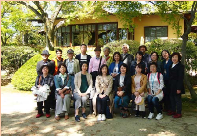
(バス見学会 聴竹居)