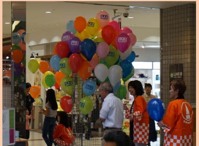
(建築士の日フェスティバル)