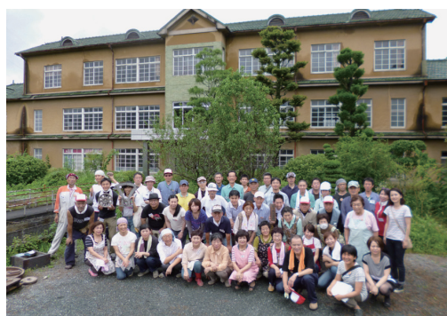
東新会 / (公社)広島県建築士会