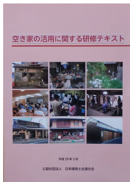
日本建築士会連合会発行

日本建築士会連合会ではこれらの流れに先立って、平成28年度、空き家の問題に対応できる人材育成を目的に、空き家の活用に関する研修テキストを作成し、その研修カリキュラムの考え方がまとめられました。