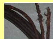
エレベーターのワイヤロープ破断事故