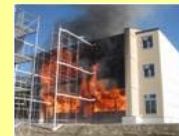
防火壁による延焼防止性能の検証