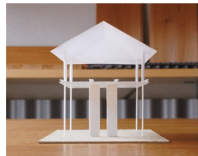
コンセプト模型(上…既存架構、下…耐震補強)