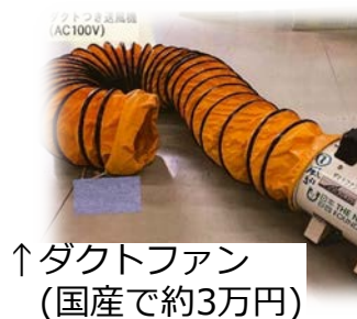
強力な風を送りたい時は…